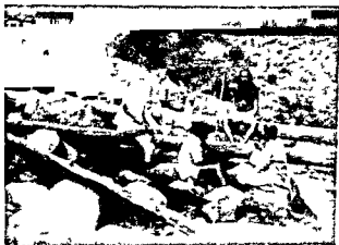
नालेपर विश्राम करते हुए दाता व अन्य लोग